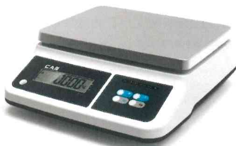
Модификация PRП-X1CD с жидкокристаллическим показывающим устройством