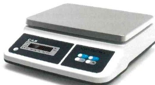
Модификация PRП-X1ED со светодиодным показывающим устройством