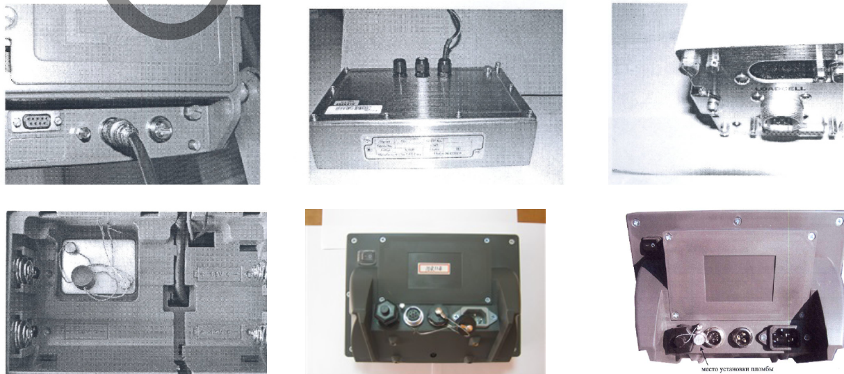
Рисунок 1 – Место пломбировки весового индикатора

Доступ к метрологической части ПО и вход в режим редактирования конструктивных параметров защищен от преднамеренных изменений с помощью пломбирования весов посредством нанесения поверителем пломбы на заднюю панель весового индикатора (предназначена для защиты от юстировки и калибровки весов (см. рис. 1)).