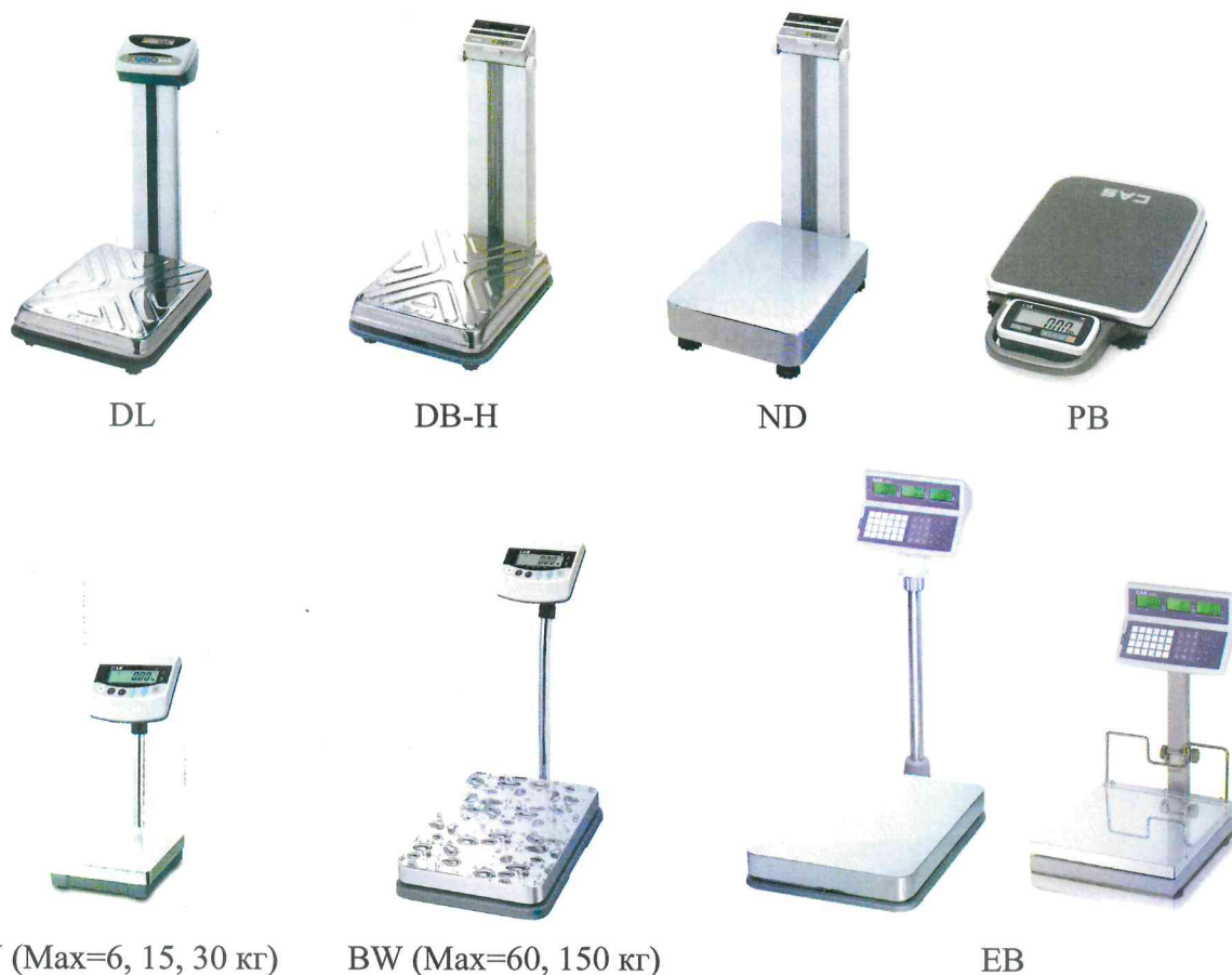
Рисунок 1 - Общий вид весов

Общий вид весов представлен на рисунке 1.